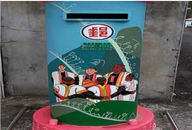
布農族文化特色郵筒