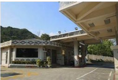
公所經營海端加油站