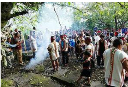
布農族射耳祭槍祭、射耳儀式