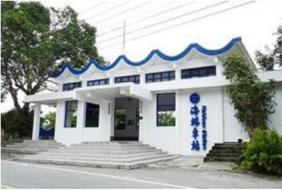
藍、白兩色共譜的海端車站