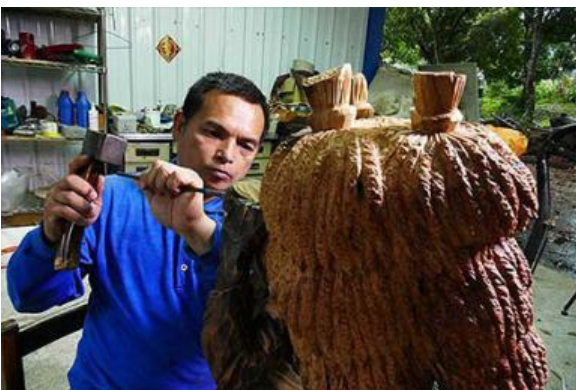
布農族木雕工藝家