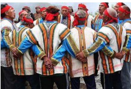
布農山地傳統音樂團